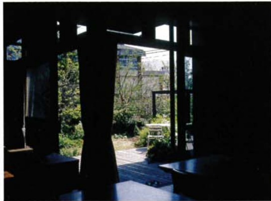
写真8 家の中から庭を通して通りを見る