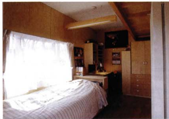
写真9 輻射冷暖房パネルのある木質仕上の児童居室