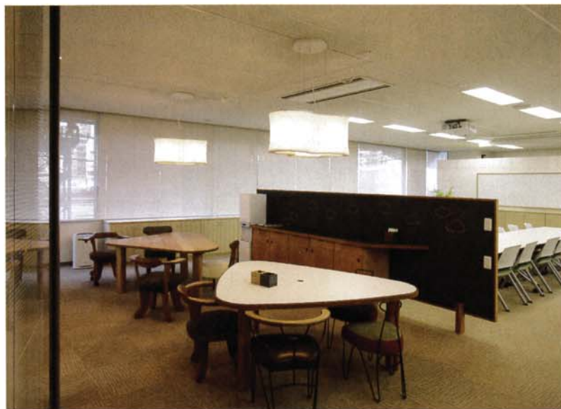
写真2 いつでもコーヒーブレイクできる会議・休憩スペース

り返されることになりがちである。「高度な医療管理が必要な子どもにとって家族と暮らすことは、かれらのQOLや幸せを考えた場合にきわめて大切なことであり、長期にわたるケアは家族で行うほうが子どもの発達成長の力が引き出され家族も安定する」という医師の信念が、このクリニックのきわめて多忙な日常活動を支えている。