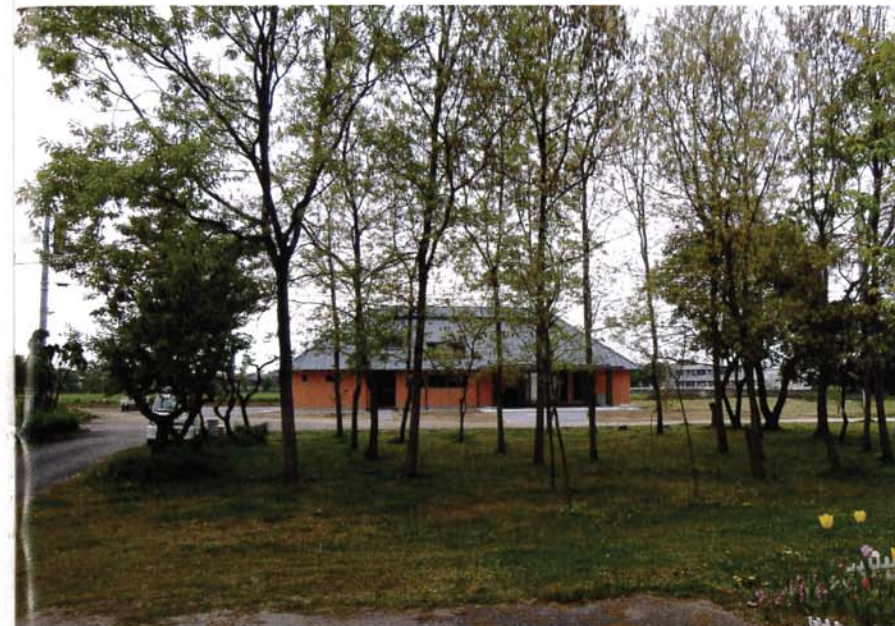
写真10 放課後学童クラブ『まりあ』正面全景

それは本園建築とも通底する“牧草地に建つBarn…納屋”のような存在の建築で、週6日(第4土曜、日祭日除く)放課後の午後から夕方6時まで、30~40人ほどの学童が通ってくる(竣工後1年間の利用者数