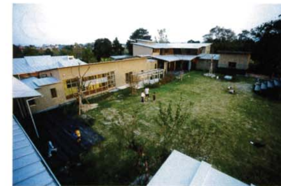
写真12 聖ヨゼフ寮全景

以上、ここまでやや特殊で少ない事例ながら紹介してきたこれら各分野、各地域における子育て環境の条件やコンセプトに共通している空間の様相は、優れて「住宅的」であり、「木漏れ日のような場所や人の状態」を呈し、「愛郷」の気持ちに満ちた世界なのである。