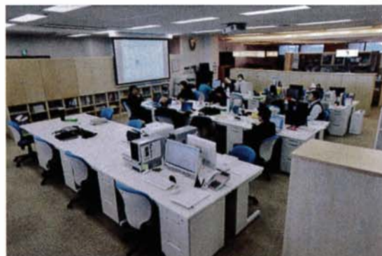
写真1 『あおぞら診療所・墨田』。着席のまま全員のカンファレンスが行えるスタッフスペース

新生児医療における救命治療の進歩に伴い、人工呼吸器などの医療機器に依存せざるを得ない子どもが増えているが、超重症児は長期入院を続けるか、自宅で家族による介護で療養するのだが、その場合家族の疲弊や子どもの症状悪化などによる入退院が繰