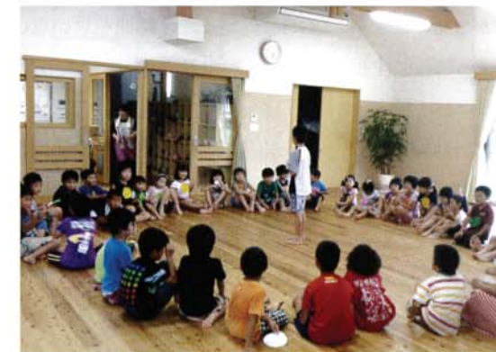
写真11 ホールで遊ぶ子どもたちの様子