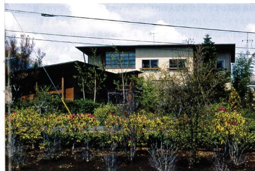
写真6 『樅の舎』外観全景。手前は桑畑

在来工法の木造構造物はそれ自体、人の居住には優しい雰囲気を醸し出すが、北欧製モダンデザインの家具、照明などを用い、白い漆喰左官仕上の内装により、明るく清潔で温もりのある居心地を得ている[写真7]。南東側の庭は、2面の狭い道路に対し低い土手と垣根で接し、主として雑木やブッシュ状のかん木を植え込んだいわば『ワイルドなガーデニング』である。それは、周辺地域とこの「家」との接し方、つまり室内からある程度通りが見え、外からは住まい手の暮らしぶりが感じられる、「地域小規模」の町の中でのあるべ