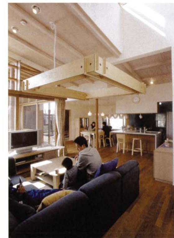
写真7 リビングからキッチン/ダイニングを見る