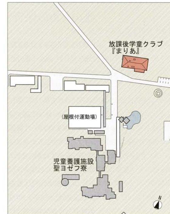
図2 広大な牧草地の中の『聖ヨゼフ寮』と『まりあ』。配置図