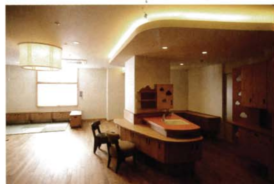
写真4 木製のオープンキッチンのあるダイルーム