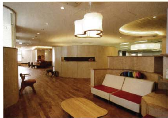
写真3 楽しいリビング感覚の待合ホール。左が診察室

これに対し、100㎡程度の診療所部分はガラスの入った木製の間仕切りで区画された3つの診察室を除き、待合ホールからキッチン、ダイルームまでが造形的で触覚的な特注家具(椎名啓二アトリエ作)で設えられ、緩やかにうねった連続空間としてつくられている[写真3、4]。そこは、主として訪問診療開始前の相談外来と家族のレスパイトのための一時預かりを想定したスペースとして考えられたものである。子どもと家族にとって、バリアフリーで清潔な診療所でありながら、温かく安心できる気のおけない住宅的でイン