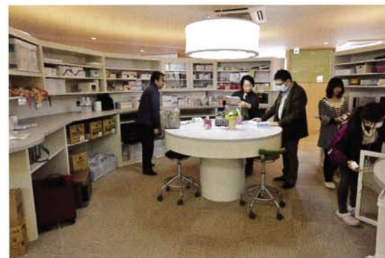
写真5 プランの要にある円形の薬品庫。訪問看護の医療バッグを装填中